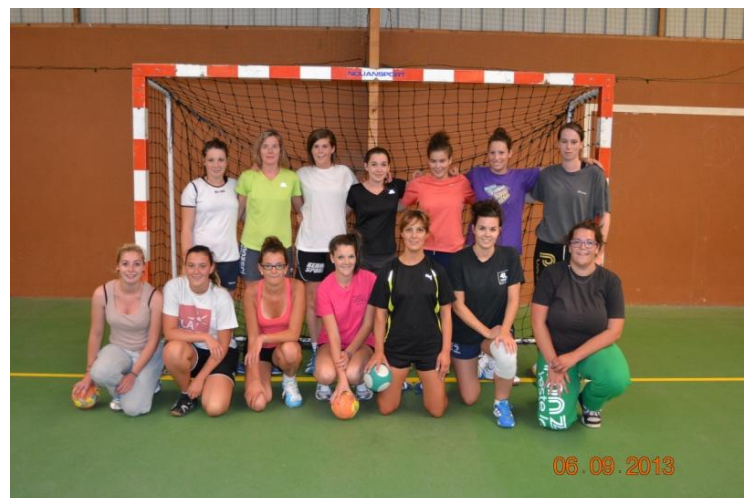
« Séniors »