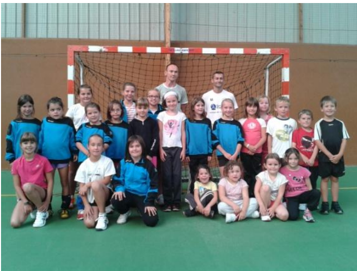
Débutantes 1 et 2 « - 12 ans »

Nous vous attendons nombreux pour nous encourager sur le bord des terrains !!!