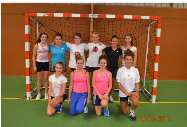
« - 16 ans »