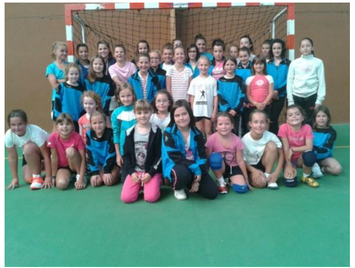
Débutantes 2 et « - 12 ans », « -14 ans »