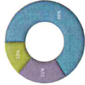
Titre du graphique