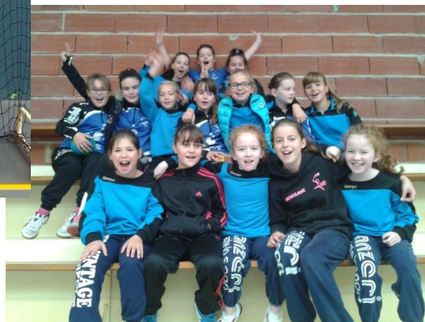
Les -12 ans qui ont également participé au tournoi de Landi le 25 octobre