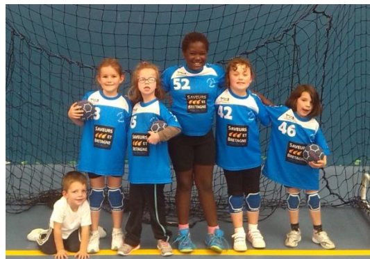
Les débutantes 1 ont atteint la finale au tournoi de Cléder

Lors de ce tournoi, nous avons pu assister à la rencontre des débutantes 2 "filles" du PBHB face aux débutants 2 "garçons" du PBHB. Les deux équipes ont démontré une très grande motivation lors de ce match qui s'est soldé par un match nul.